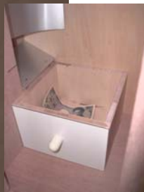
紙幣収納箱(搬送が付いていない為、金庫は設置出来ません)