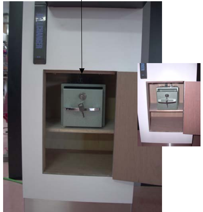
硬貨収納ボックス+硬貨金庫(鍵付)

サンドに各硬貨(100円、500円)または紙幣が投入されると、硬貨収納ボックス及び紙幣収納箱に収まる構造になっています。(100円硬貨、500円硬貨は同じ収納箱になります)