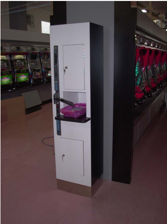
写真は1000円札対応サンド設置例